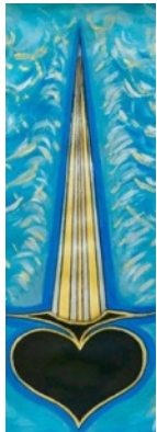
As De Pique

La porte, le début du voyage spirituel. Le Magicien porte déjà cette baguette, symbole de pouvoir de lumière et d'énergie. L'esprit devra combattre les pièges de l'illusion. Le pèlerin devra travailler sans cesse la confiance en lui et en la vie.