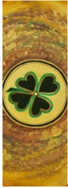
As de Trèfle

Relié à l'élément TERRE Deux infinis rassemblés, deux lacs d'amour réunis. Le 1 représente le commencement, l'affirmation de soi dans l'action, le travail. Le JE SUIS. Il symbolise l'être et son ego. Cette pièce d'or est déjà sur la table du Magicien. Elle représente la terre au milieu d'une galaxie. C'est un mandala énergétique. Travail, possibilité de réussite, créativité. Vaincre les obstacles par la volonté et le courage.