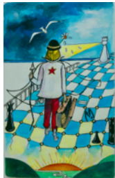
La Quête Alchimique.

Découverte des 12 premières cartes du Tarot d'Or